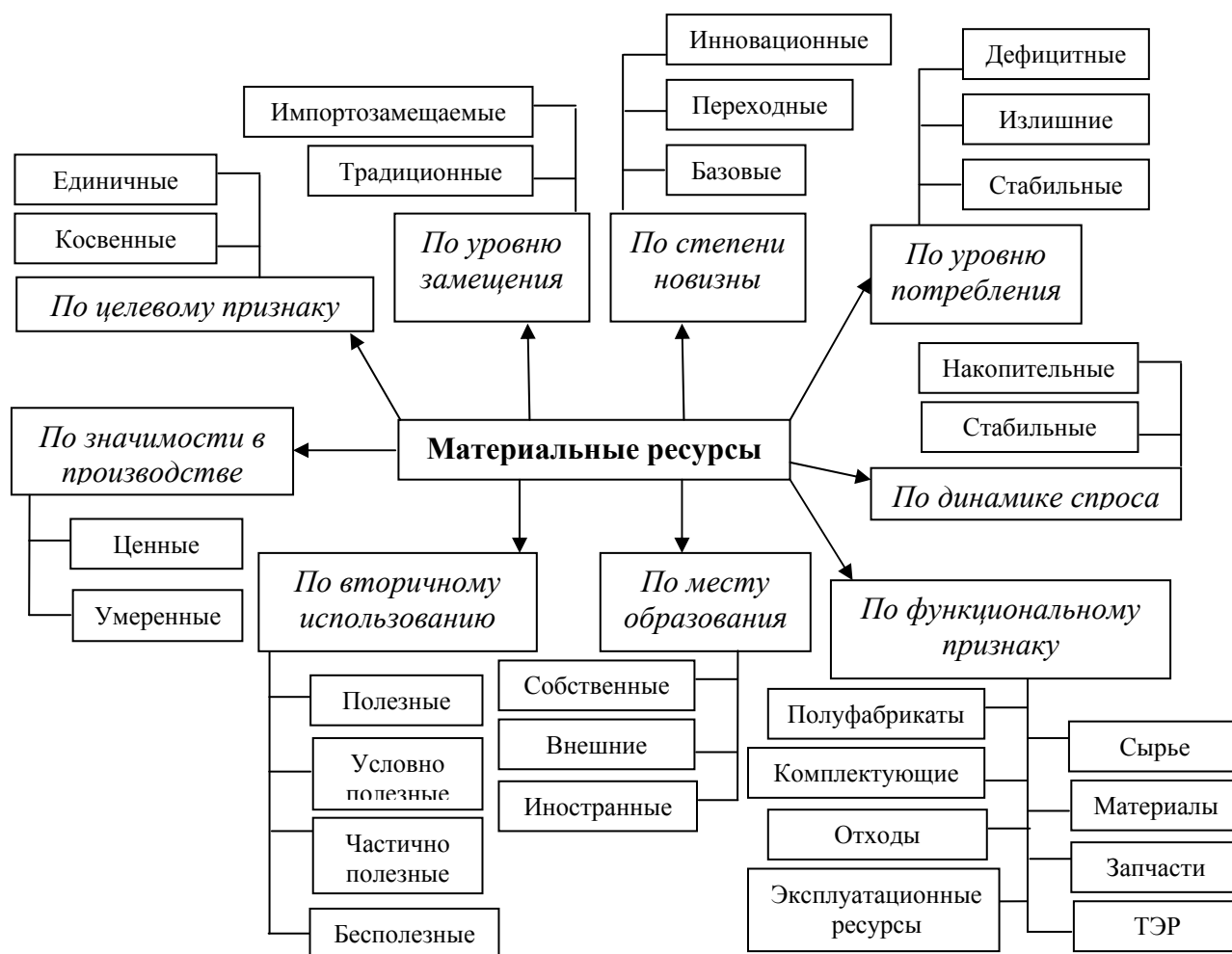
Рис. 1. – Классификация материальных ресурсов на промышленном предприятии

продукции позволяет обеспечить большую эффективность реальных инвестиций [24].