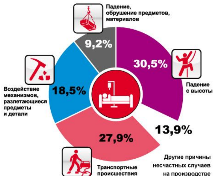
Рис. 2 Распределение причин производственного травматизма по видам работ и травмирующим факторам

В 2016 году каждую секунду получают травму на производстве четверо рабочих.