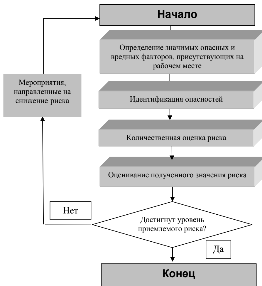
Рис 3. Итеративная расчетная модель оценки рисков

использовать для прогнозирования параметров состояния производственной среды, опасных ситуаций и опасных зон. На рабочих местах, где условия труда характеризуются влиянием вредных производственных факторов, существует определенная вероятность воздействия этих факторов, а, следовательно, риск получения профессионального заболевания или травмирования работника.